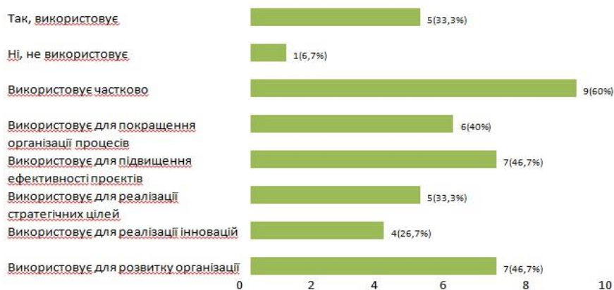
Діаграма 1. Чи використовує ваша церква / релігійна організація проєктний менеджмент і для чого?

Результати досліджень засвідчують недостатній рівень застосування проєктного менеджменту релігійними організаціями. Так, тільки 33,3 % респондентів зазначили, що їхні релігійні організації використовують проєктний менеджмент у своїй діяльності, а 60 % використовують частково.