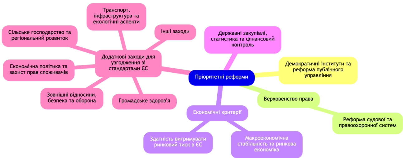
Рисунок 2. Пріоритети реформ для вступу України до ЄС

реформи у галузях енергетики, сільського господарства, транспорту й інфраструктури, охорони довкілля (рис. 2) [5].